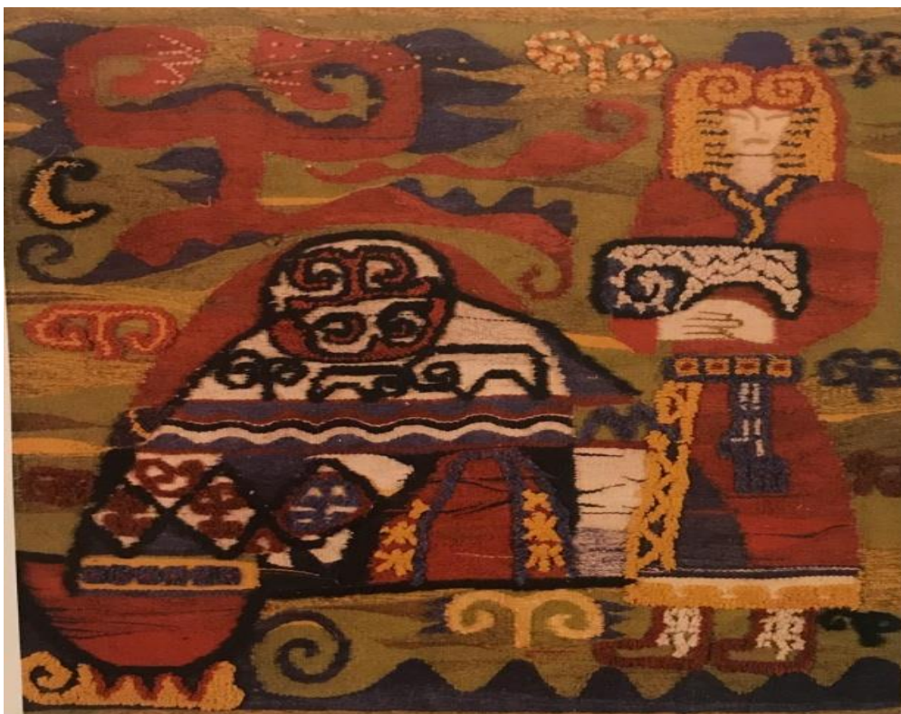
«Шопан» гобилен, тоқыма техникасы. 1970 жыл