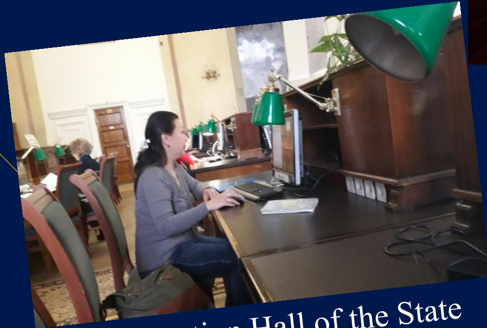
Dissertation Hall of the State Library. Lenin, Moscow.