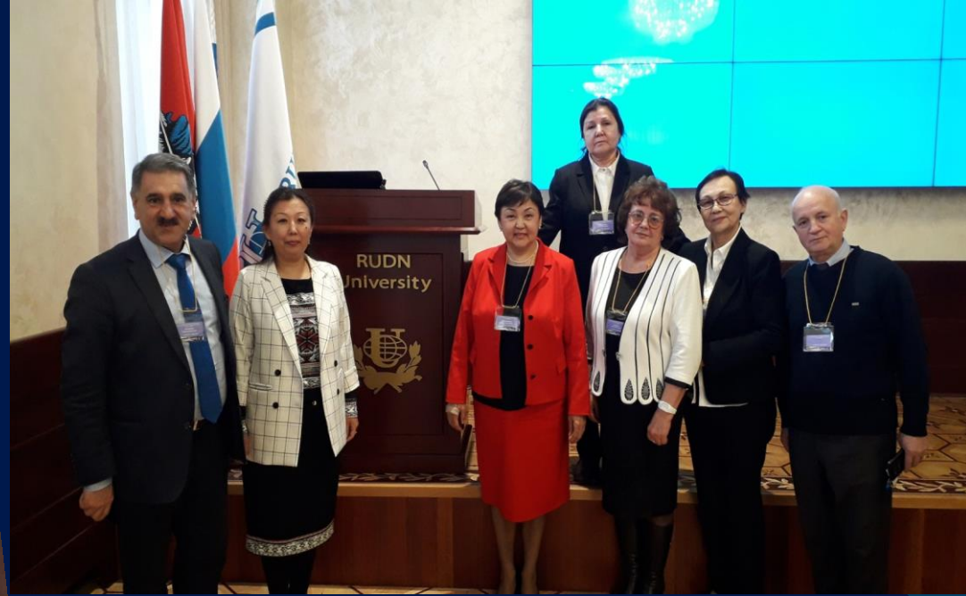
Participants of the International Scientific and Practical Conference "Bi-, Poly-, Translingualism and Linguistic Education", dedicated to the 90th anniversary of Georgy Dmitrievich Gachev.