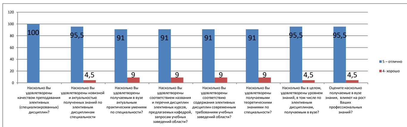
Диаграмма 1. Оценка магистрантами качества и актуальности Образовательных программ