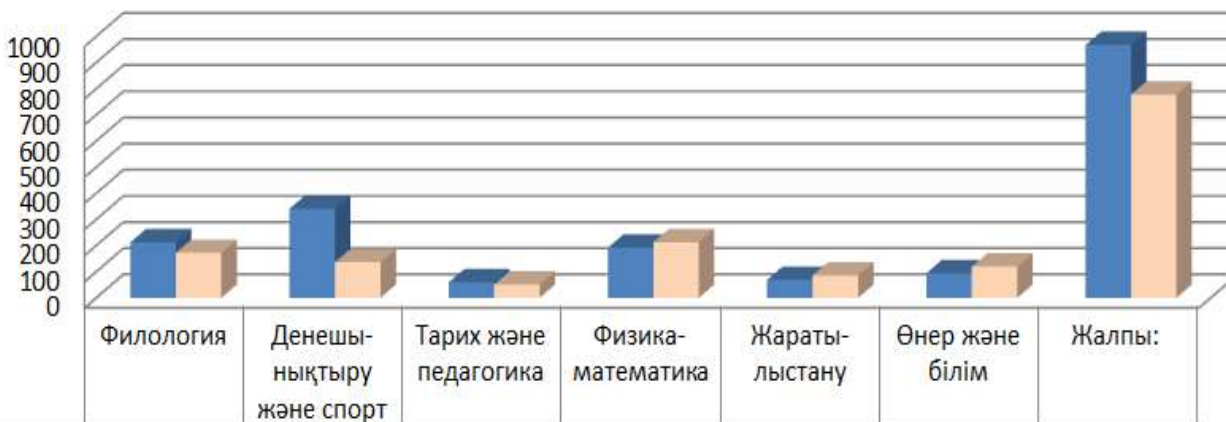
Қысқы және көктемгі емтихан сессиялары бойынша "FX" саны