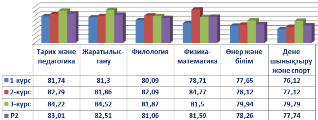
Факультеттер бойынша Р2 орта мәндерінің үлестірілімі